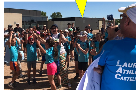
KID'S ATHLE du LAC, juin 25

Besoin de renfort pour notre école d'athlé : entraîneurs ou assistants entraîneurs, soyez les bienvenus !